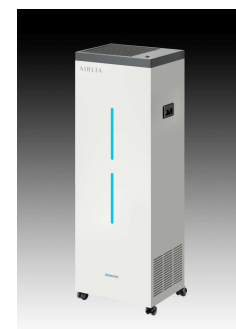
エアアリーア プラス

(製品詳細は https://www.iwasaki.co.jp/optics/sterilization/air/plus.html をご参照ください)