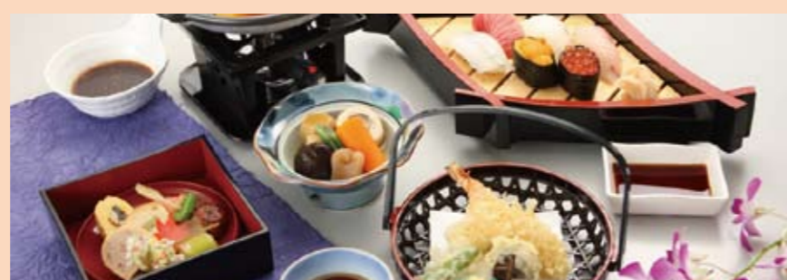
料理・飲料関係 (提携会社利用に限る)