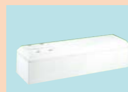
棺・納棺用具一式